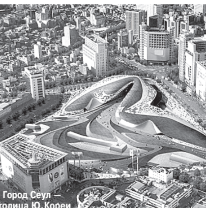
Город Сеул столица Ю. Кореи

рять на себя робу нелегального трудового мигранта, искать заработки в других странах.