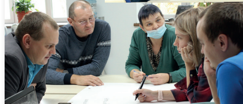
РУСАЛ – Красноярский алюминиевый завод